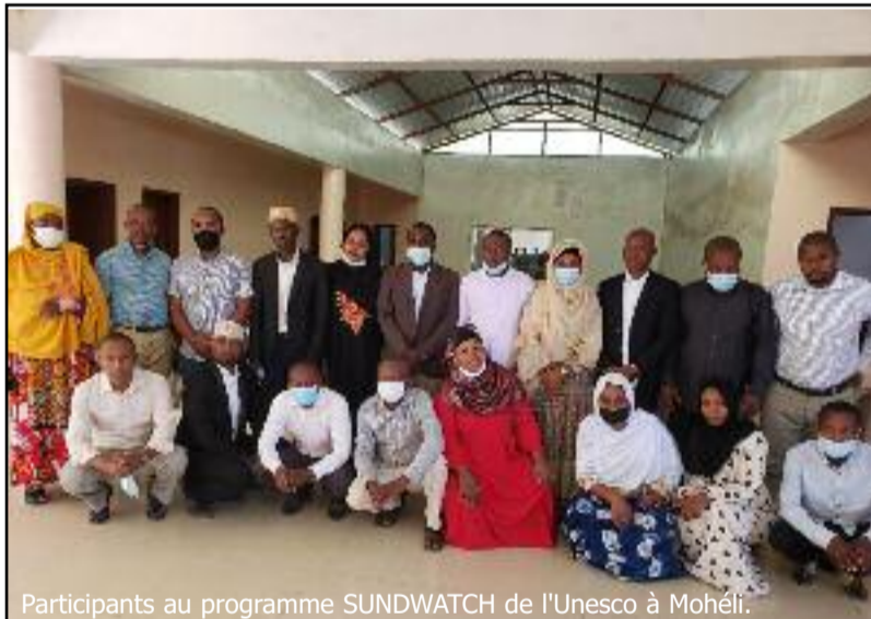
Participants au programme SUNDWATCH de l'Unesco à Mohéli.

sont appelés à adopter un comportement favorable à la protection de leurs plages.