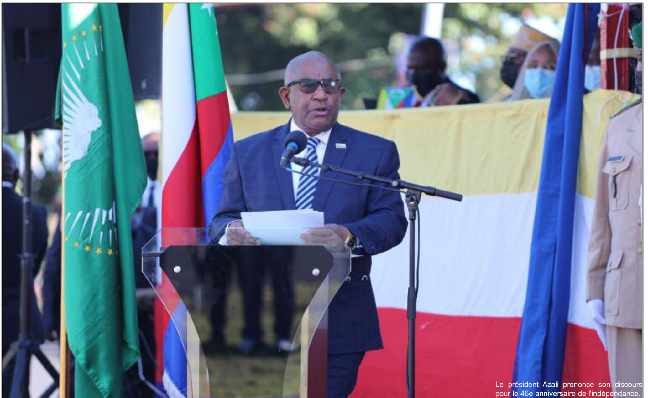
Le président Azali prononce son discours pour le 46e anniversaire de l'indépendance.