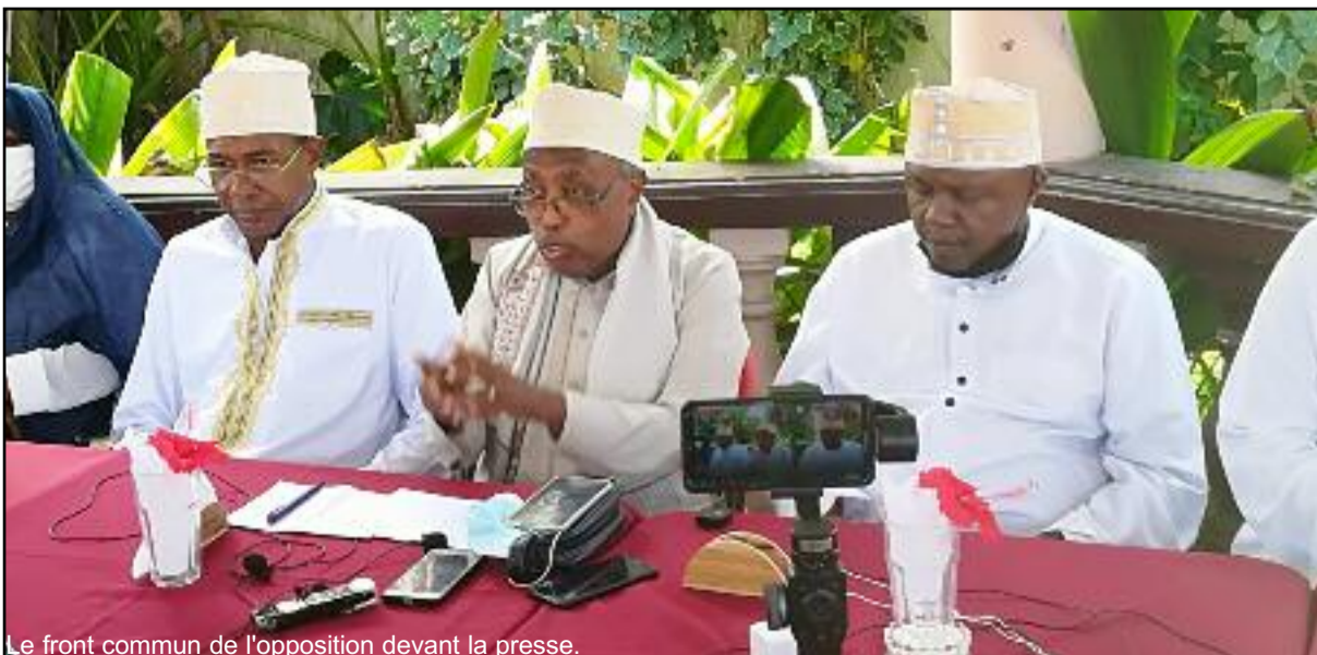
Le front commun de l'opposition devant la presse.