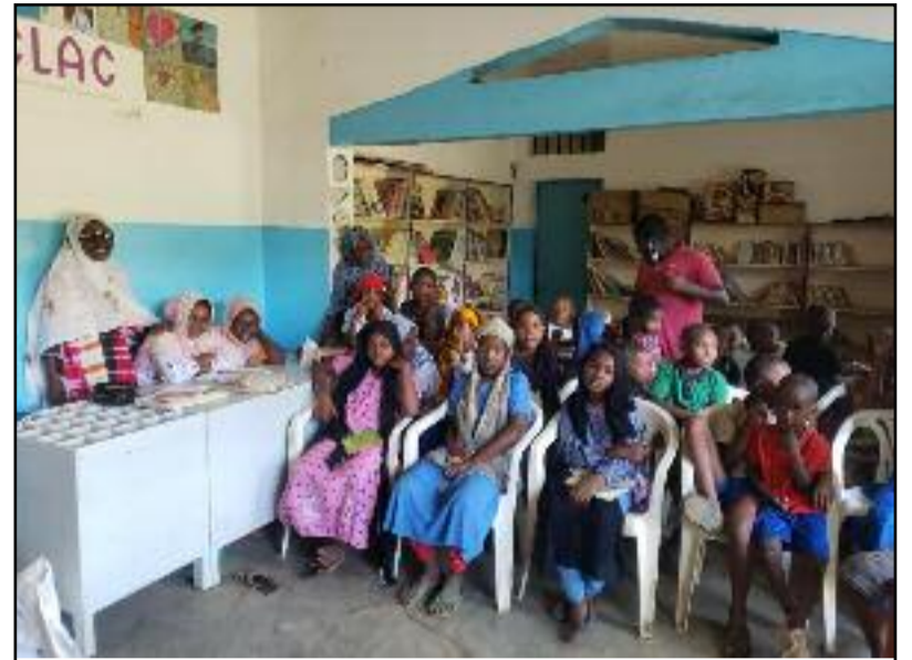
Célébration du 6 juillet au CLAC de Salamani.