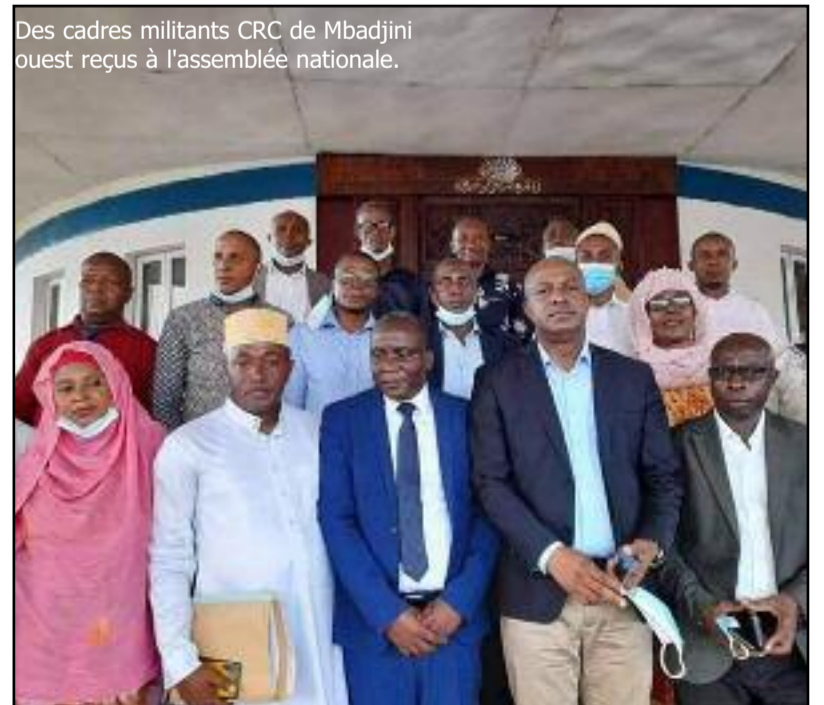
Des cadres militants CRC de Mbadjini ouest reçus à l'assemblée nationale.