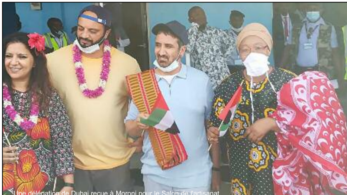
Une délégation de Dubaï reçue à Moroni pour le Salon de l'artisanat.